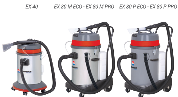
POMPA - PUMP EX 40 - EX 80