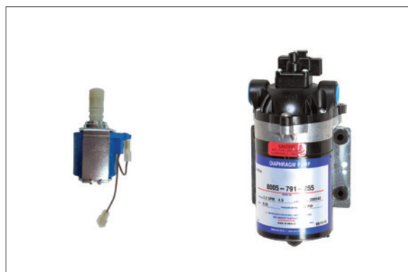
POMPA - PUMP EX 80 PRO