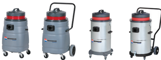
SM 50 B AC