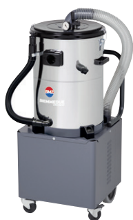
QT 30 - QT 40